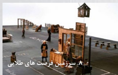
۸. سرزمین فرصت های طلایی