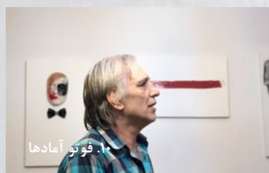
۱۰. فوتو آمادهها