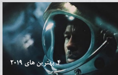
۴. بهترین های ۲۰۱۹