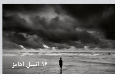
۱۶. انسل آدامز