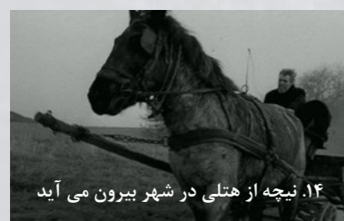
۱۴. نیچه از هتلی در شهر بیرون می آید